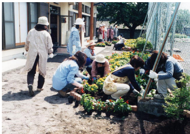
花の植え付け状況 ○月○日