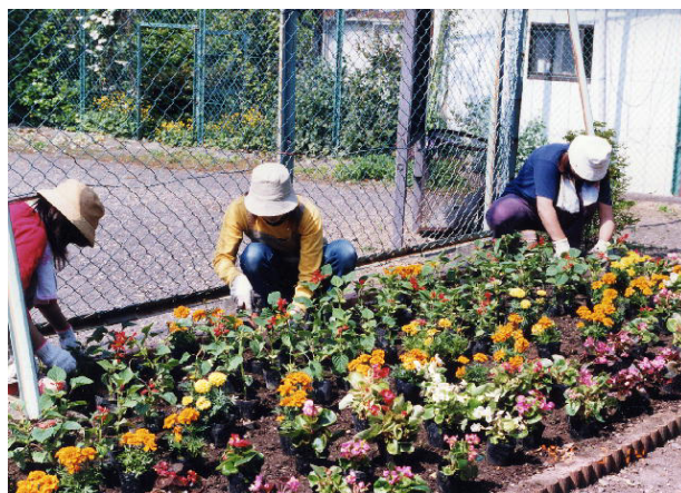
草むしり状況 ○月○日