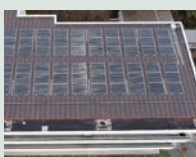
太陽光発電の設置 (沼田東中学校)

学校施設を中心に再エネを導入。近年では、災害時の指定避難所に太陽光発電設備と蓄電池を設置し、非常用の自立電源として利用できるよう整備しています。